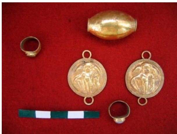
Рис. 1. Золотые предметы из инвентаря погребения № 12 некрополя городища «Белинское».

Таким образом, культ Афродиты и Эроса, зафиксированный археологическими артефактами на городище «Белинское», уже на самом начальном этапе существования этой крепости, скорее всего, был связан с необходимостью демонстрации местными военачальниками, в том числе, и членами их семей, своей приверженности Римской империи и её официальной идеологии.