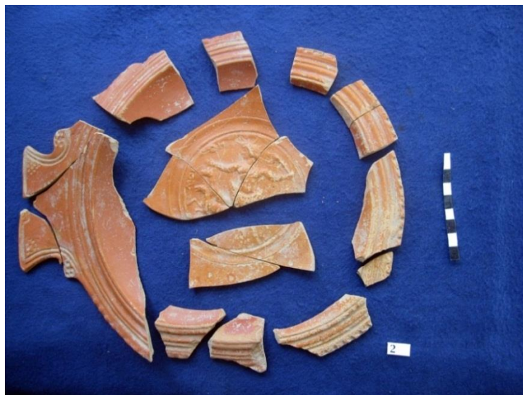
Рис. 1. Фрагментированное блюдо с оттиснутым рельефным медальоном с изображением Гелиоса на квадриге из раскопок склепа №19 некрополя городища «Белинское».

Но теперь он больше символизировал не столько тепло и радость божественного света, сколько представлялся эффективным способом божественной мести по отношению к людям, совершившим страшные преступления.