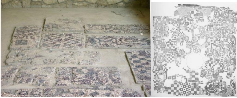
Илл. 1. Напольная мозаика Гордиона. IX – VIII вв. до н.э.